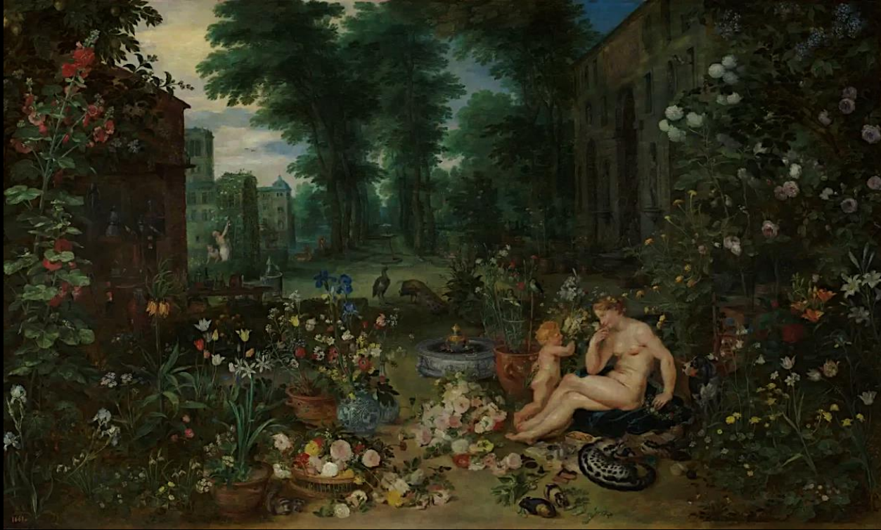
'The Sense of Smell,' by Jan Brueghel the Elder and Paul Peter Rubens