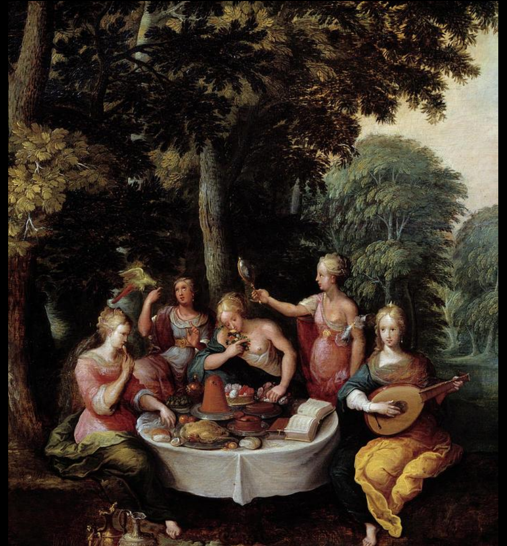
The Five Senses By Franz Frans Francken II Le Jeune